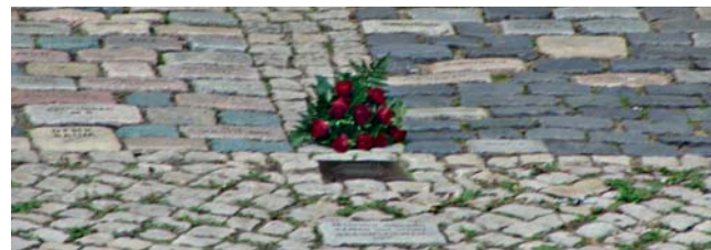
Denkraum „Namen und Steine“ vor der Martinikirche in BS

Ein Langschläferfrühstück mit vielen Leckereien. Eingeladen sind alle Interessierten.